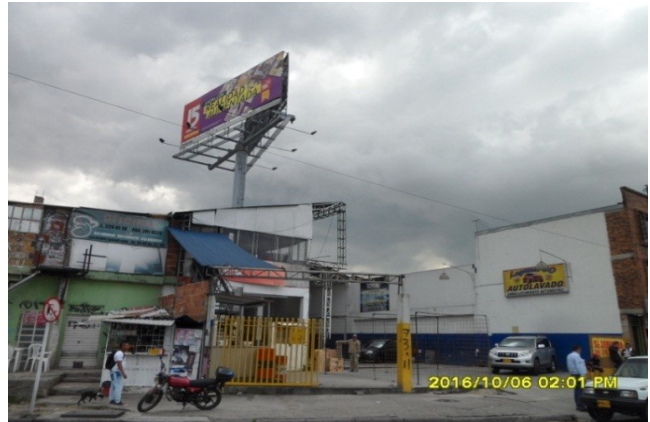
FACHADA DEL PREDIO