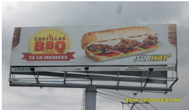
SENTIDO ESTE-OESTE DE LA VALLA COMERCIAL TUBULAR