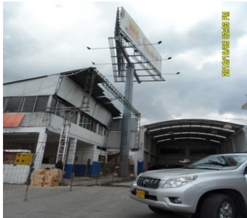
UBICACIÓN DE LA VALLA EN EL PREDIO