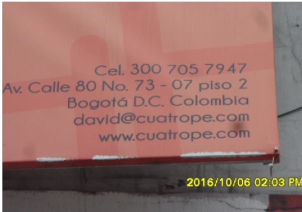
DIRECCION DEL PREDIO